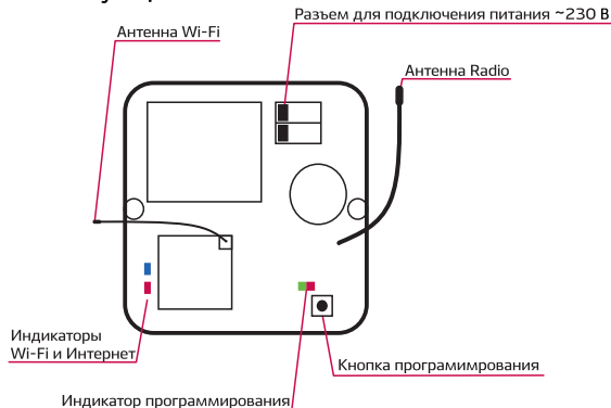
Рис. 1 - Мини-сервер 8767

Управление устройством производится с помощью мобильного приложения Nero Server, установленного на смартфон/планшет iOS или Android.